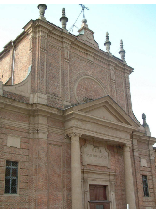
Chiesa di San Francesco

“Una corda a tre capi difficilmente si rompe” e, dopo 800 anni, constatiamo ancora oggi la vitalità francescana. Il terzo Ordine è chiamato O rdine F rancescano S colare (OFS) nell'ultima Regola sigillata con l'anello del pescatore da Papa Paolo VI il 24 giugno 1978 (l'ultimo suo atto ufficiale).